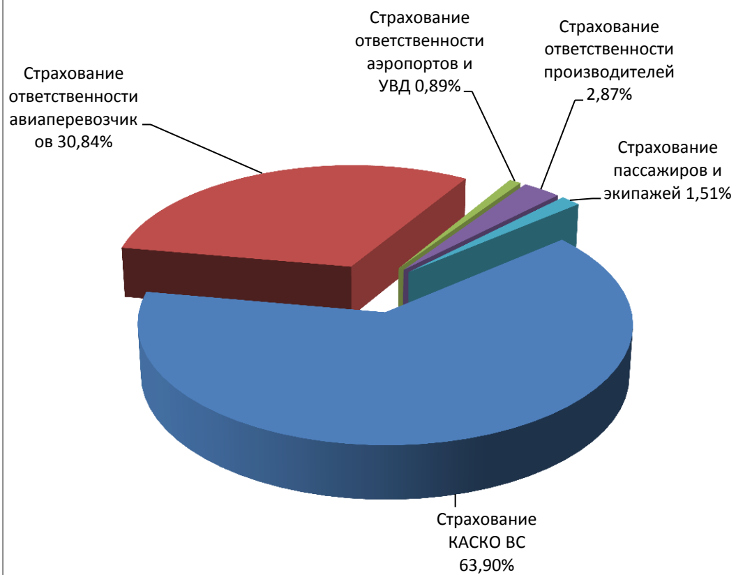
Диаграмма 1. Структура страховых премий по прямому страхованию